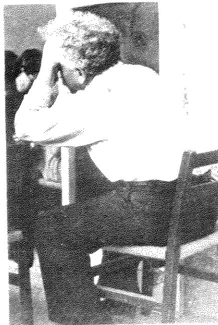
ברל כצנלסון