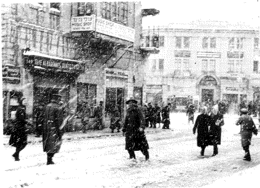
שלג בירושלים, 1942