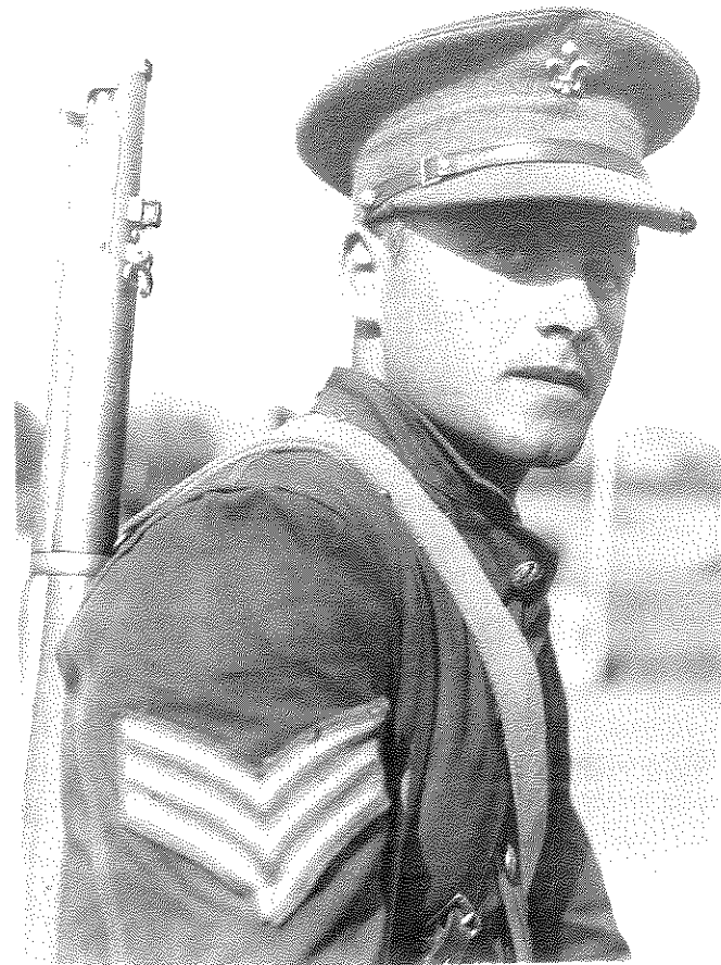
מלוחמי וינגייט