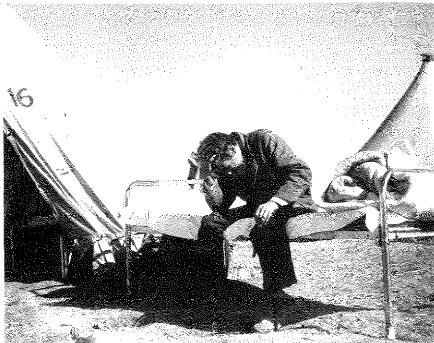
פליט במלחמת העצמאות – יהודי שפונה מביתו בשכונת מנשיה, בשיכון זמני. צילום של ה. פין

תמונות הווי בשביל קרן היסוד והמוסדות. אל צלמים אלו יש להוסיף צלמים אחרים, שפעלו בארץ ותיעדו את ההתיישבות היהודית, כמו בן דב, סוסקין, קורבמן, צבי פייגין, אורשקס אורון, ארדה ועשרות צלמים אחרים שציי- לומיהם הם עדות למה שהתרחש בארץ ולמה שהשתנה בה. אולם, הם לא היו צלמים עתונאים, הרודפים אחרי מאורעות כדי לקלטם ולהפיצם בכתיב עת.